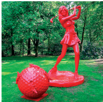
William Sweetlove. La golfeuse et ses deux balles.

Le musée invite l'artiste William Sweetlove à investir le parc Fénelon avec ses sculptures monumentales. Ses clones rouges et démesurés sont les projections désastreuses d'une société sourde au réchauffement climatique. Entre la nature du parc et celle de l'artiste, les œuvres questionnent le visiteur sur l'avenir qu'il sculpte par ses gestes quotidiens. EXPOSITION PRÉSENTÉE DU 18 MAI AU 31 DÉCEMBRE 2019